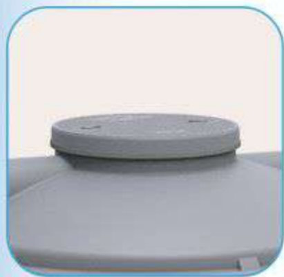
Trou d'homme couvercle

Matériau 100% imputrescible et incorrodable