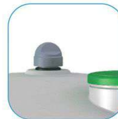
Aération en partie haute